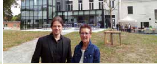
Kunstacademie Landen officieel geopend (p. 3)