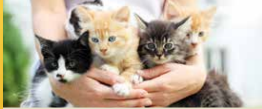
Een hart voor dieren (p. 2)