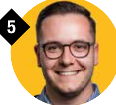
Spelmans Dries Landen 23 jaar Bewakingsagent